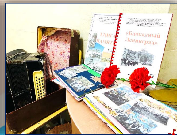
"День Победы». Бессмертный полк