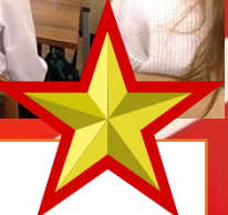
«Основы православной культуры»