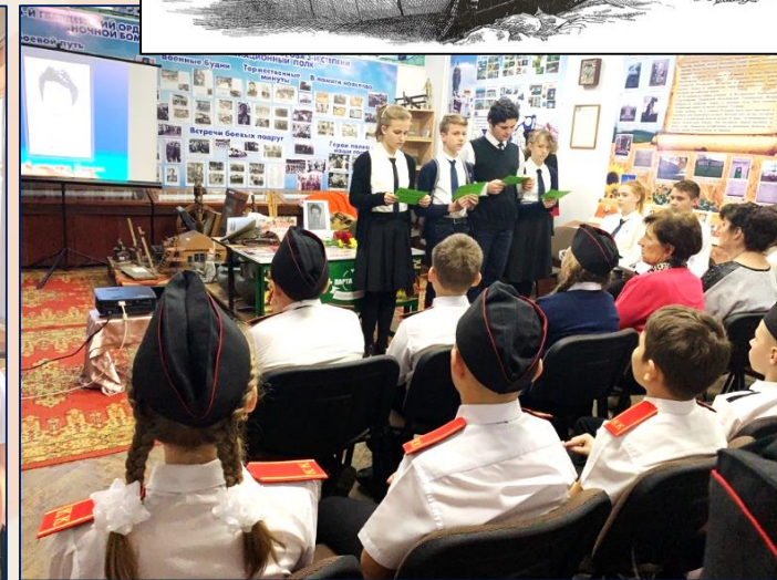
Открытие Парты Героя