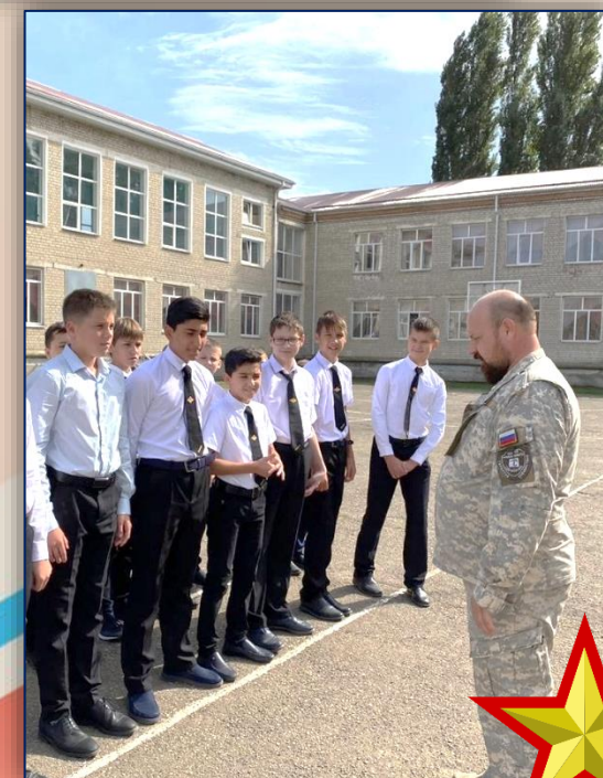
«КАЗАКИ» учащиеся 9 «Б» класса