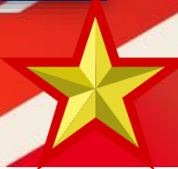
"День Победы». Уроки Мужества