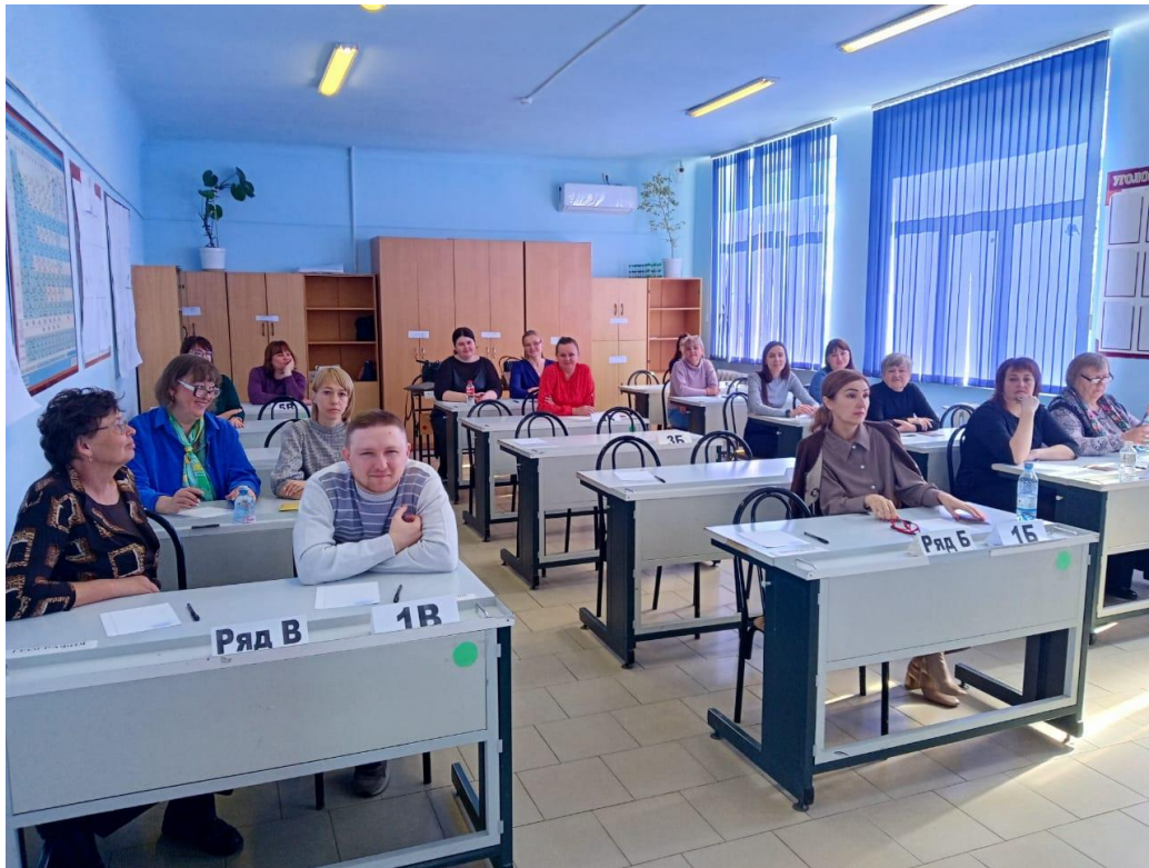
Процедура проведения региональной оценки компетентности