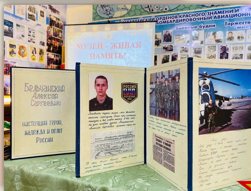
Экскурсии для гостей нашей школы