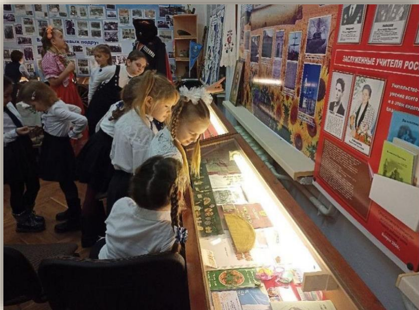
Экскурсии для учащихся 1-11 классов