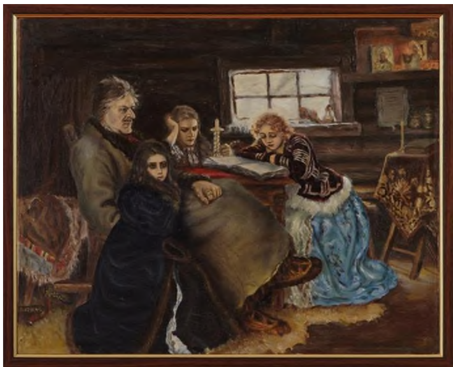
Меншиков в Берёзове. Художник В.И. Суриков

Рассмотрите картину и выполните задания.