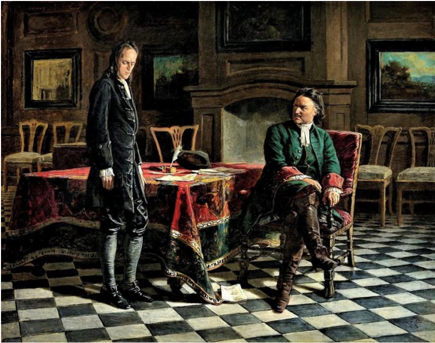
Пётр I допрашивает царевича Алексея. Художник Н.Н. Ге

Реформы Петра вызывали неприятие у многих, главным образом у патриархальной аристократии, видевшей в них разрушение традиционного для нее мира. Недовольные реформами нуждались в лидере. Если раньше таковым была сестра царя — Софья, то после ее заточения в монастырь все недовольные стали группироваться вокруг сына царя Алексея , воспитанного на старинных традициях московского двора. Расхождения между отцом и сыном становились все более очевидными. Опасаясь за свою судьбу, Алексей в 1716 году бежал из России в Австрию, где пытался искать поддержки в борьбе с отцом. Усилиями петровского дипломата и будущего главы Тайной канцелярии графа П. А. Толстого беглец был возвращен и предстал перед судом. Под пытками он признался в заговоре против царя и был приговорен к смертной казни, однако при невыясненных обстоятельствах умер в тюрьме. Петр постоянно думал о судьбе проводимых им преобразований. «Дело царевича Алексея» побудило его изменить порядок наследования престола. В 1722 году был подписан указ, согласно которому царь мог назначить себе любого преемника, вне зависимости от степени родства. Однако сделать этого Петр так и не успел. Простудившись в январе 1725 года, он скоропостижно скончался.