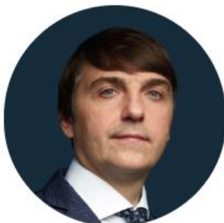
Кравцов Сергей Сергеевич

Министр просвещения Российской Федерации