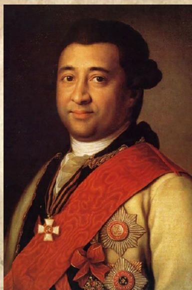
А. П. Ганнибал