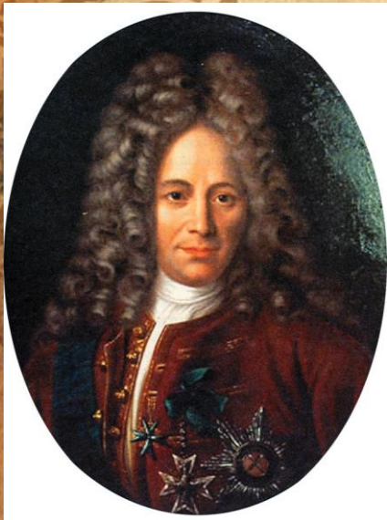
Г. И. Головкин