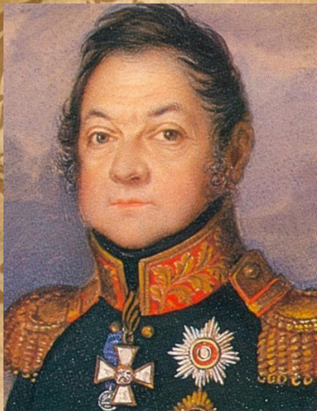
Д. С. Дохтуров