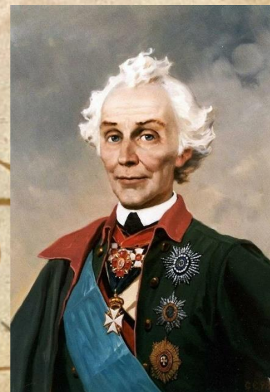
В. И. Суворов