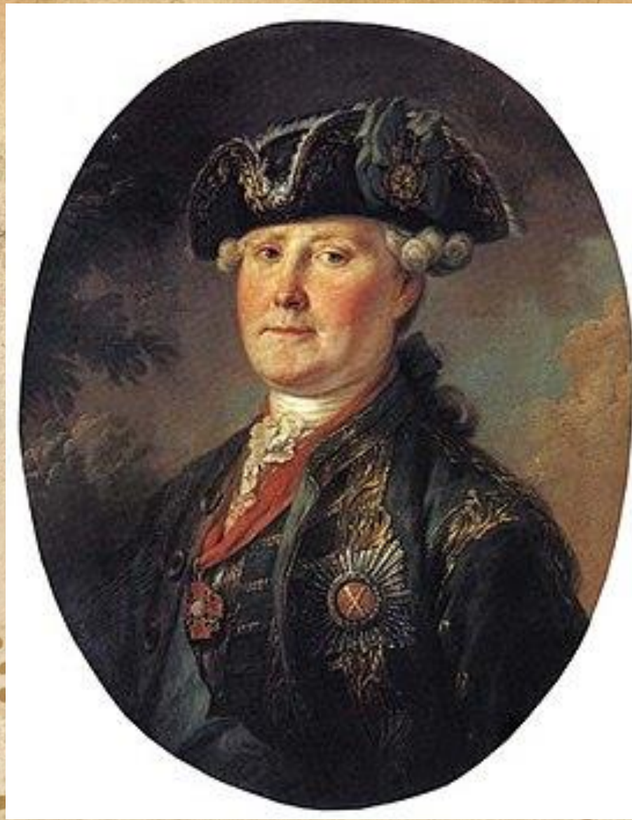
Семён Кириллович Нарышкин