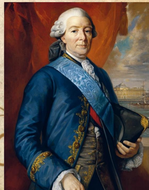
И. И. Бецкой