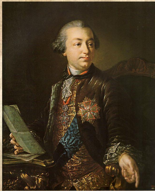
И. И. Шувалов