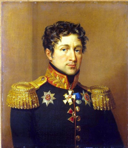
М. А. Милорадович