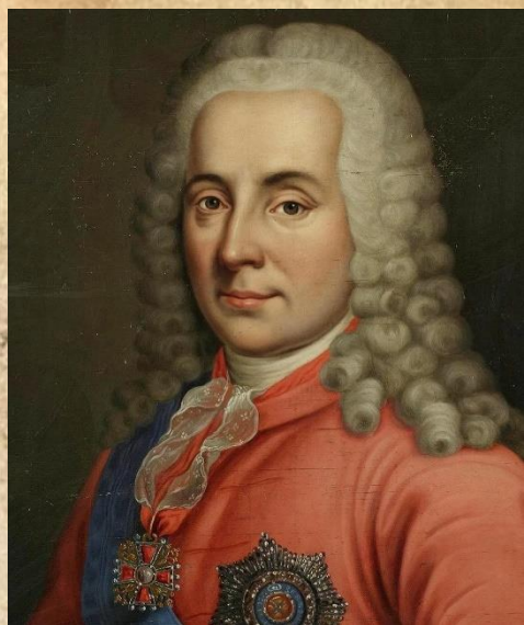
А. Д. Меншиков