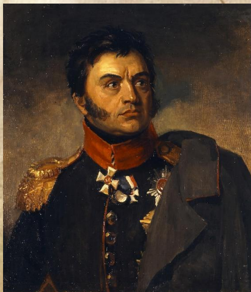
Н. Н. Раевский