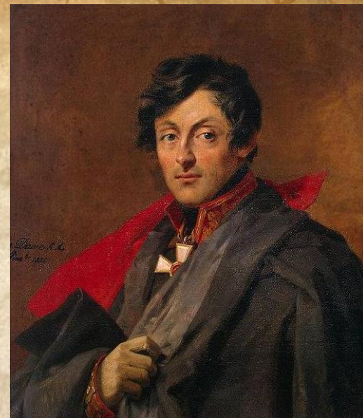
А. И. Остерман-Толстой