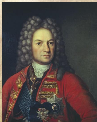
Я. В. Брюс