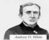
Andrew D. White 1897-1902