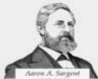
Aaron A. Sargent 1882-1884