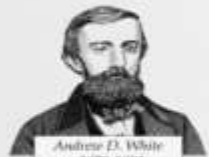
Andrew D. White 1879-1901