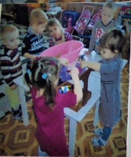
Покупам куклу Машу, постираем платье ей. Будет наша Маша чистой, поиграем дружно с ней!