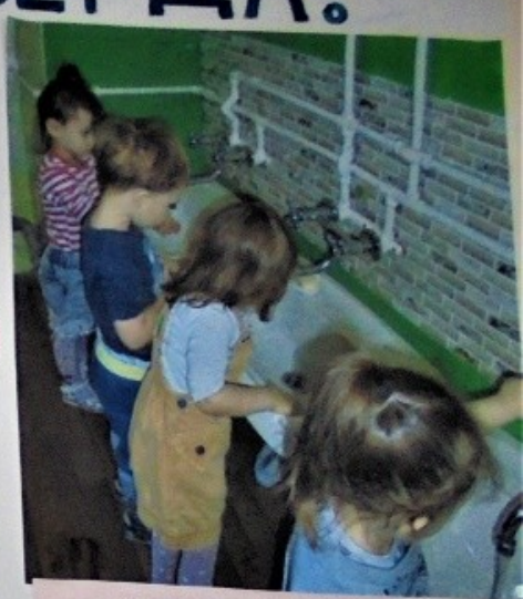
Знают дети закон такой – моим руки перед едой Дружим мы с мылом душистым и полотенцем пушистым!

Ай, лады, лады, лады, Не боимся мы воды! Чистая водичка Умоет наше личико, Вымоет ладошки, Намочит нас немножко, Ай, лады, лады, лады Не боимся мы воды, Чисто умываемся, Маме улыбаемся!