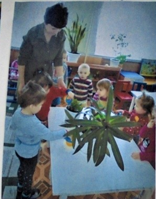
Взяли лейки малыши, пусть попьют воды цветы. Станут подрастать скорей, будут радовать детей!