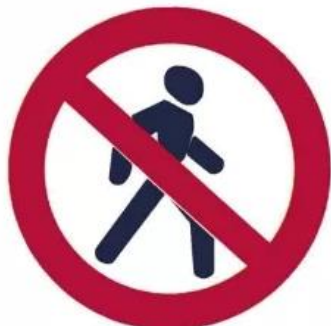
Движение пешеходов запрещено