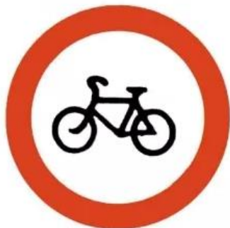
Движение на велосипедах запрещено