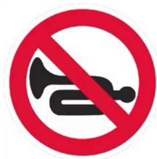
Подача звукового сигнала запрещена