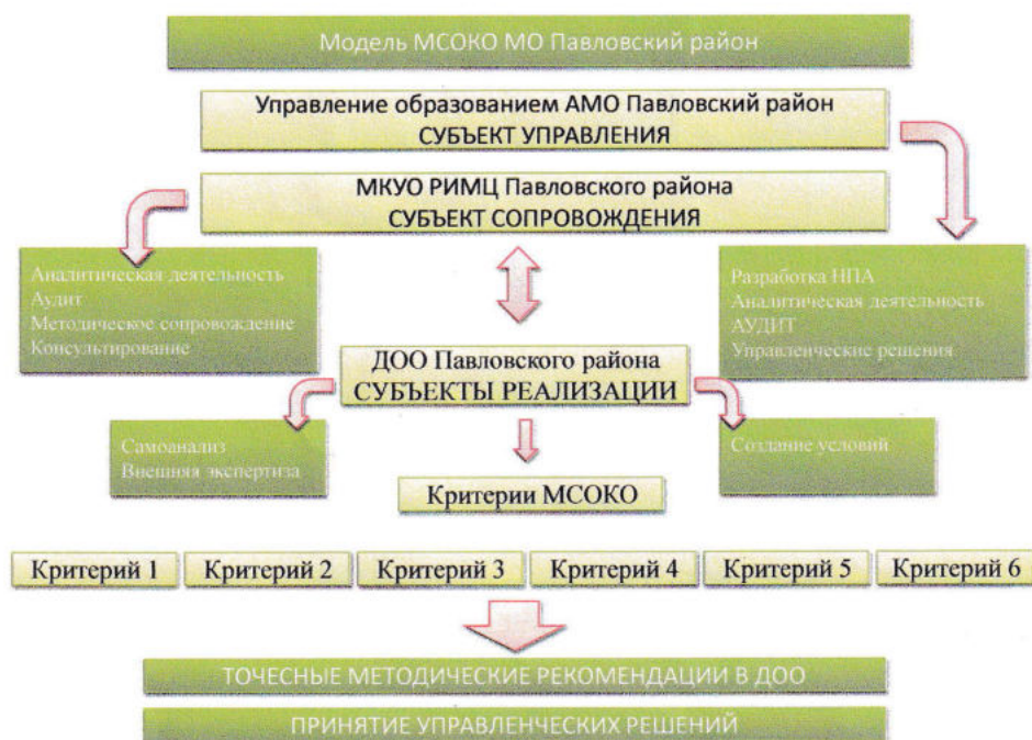
Рисунок 1 – Модель МСМОК ДО

В системе предусмотрены функции, мероприятия каждого субъекта.