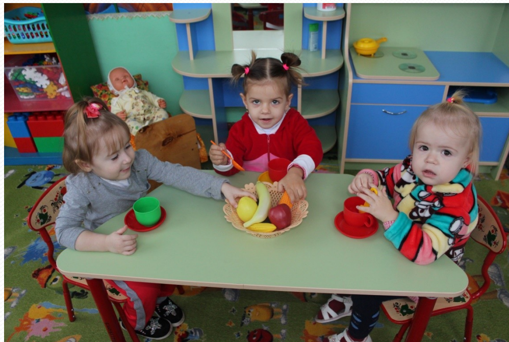
«Чаепитие у бабушки»