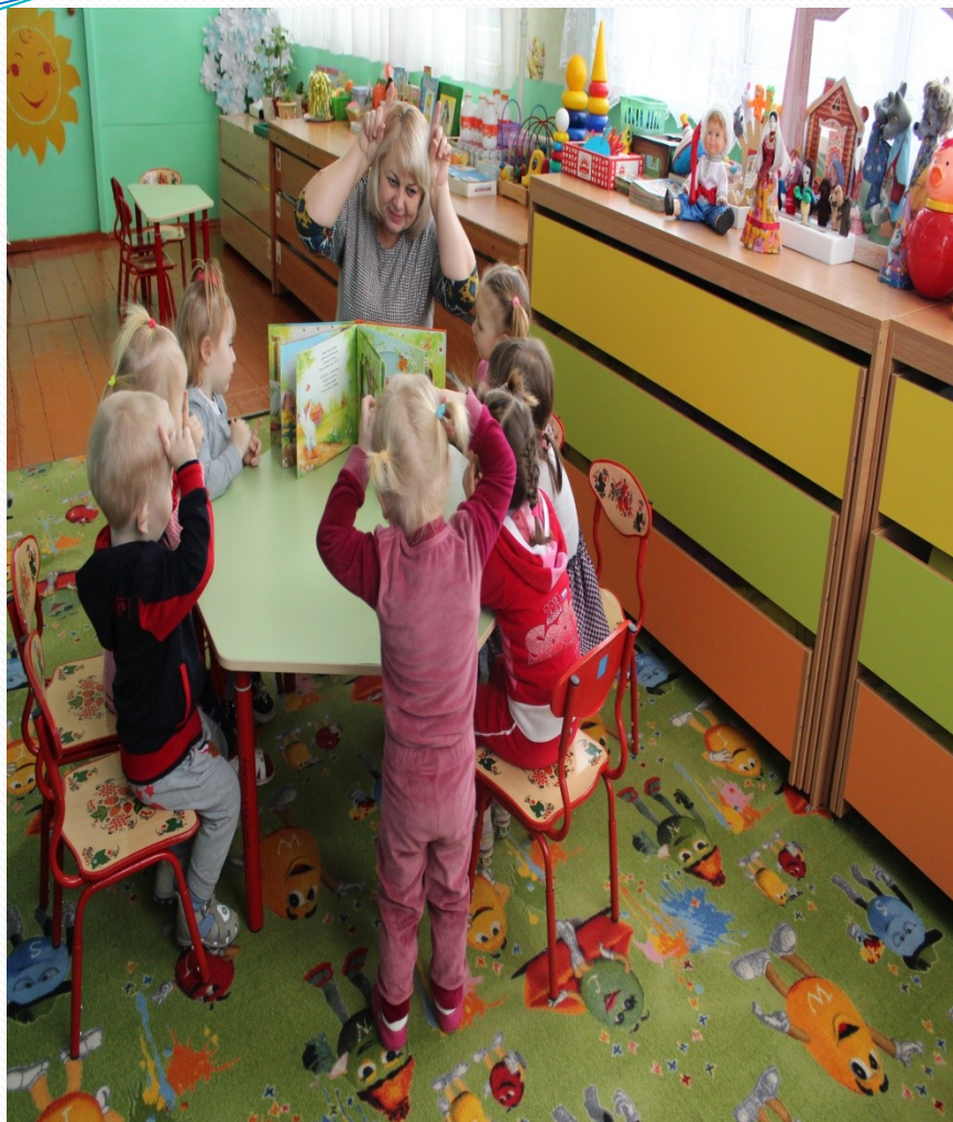
Чтение народных потешек