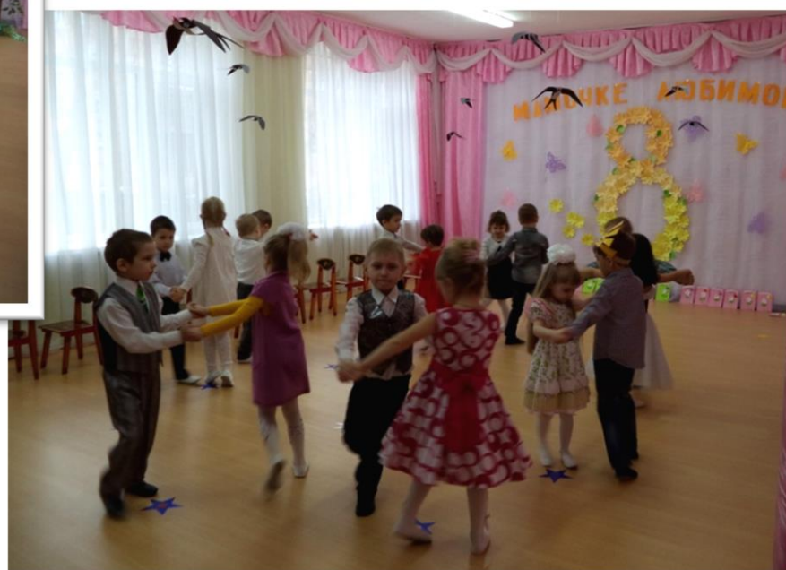
Полька «Веселые дети»