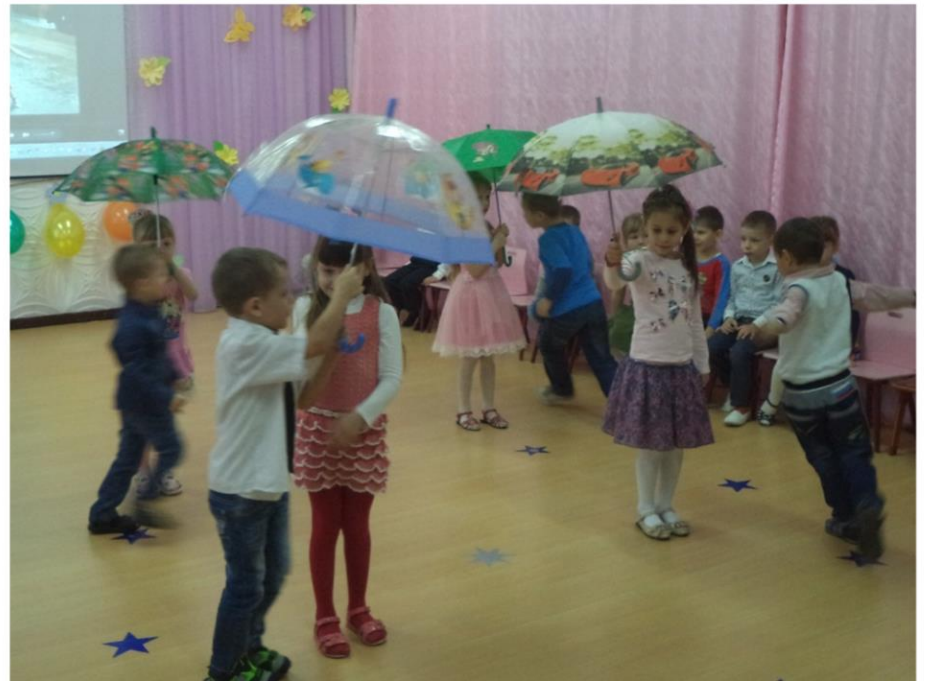
Танцы с зонтиками