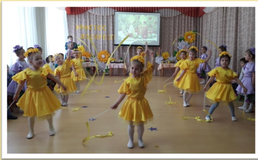
Танец «Весенняя картинка»