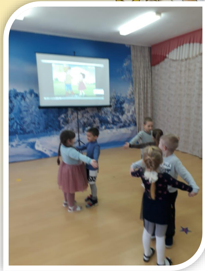
Танец с Дракошей