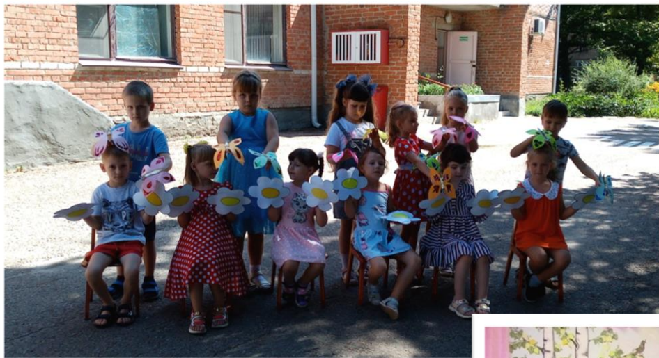
«Цветочки – бабочки!»