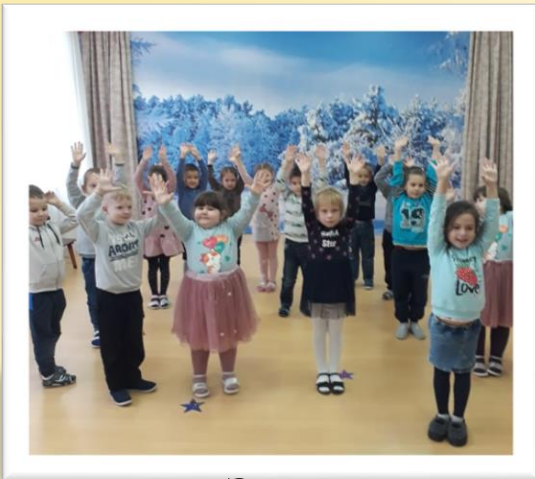
«Ура, к нам Зима пришла!»