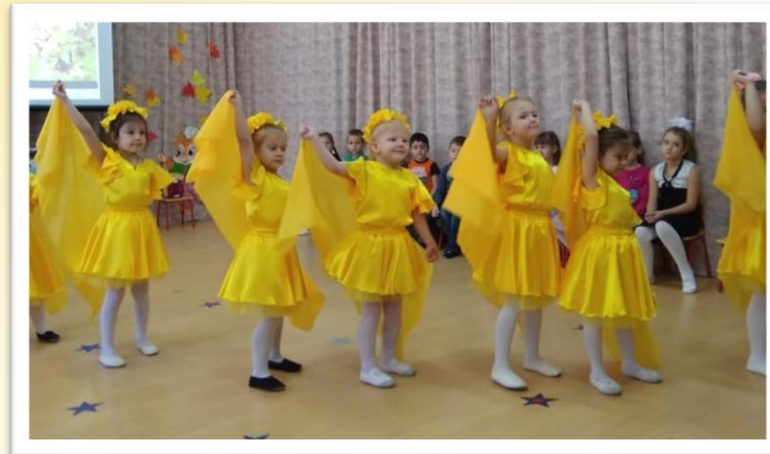
Танец «Желтый вальс»