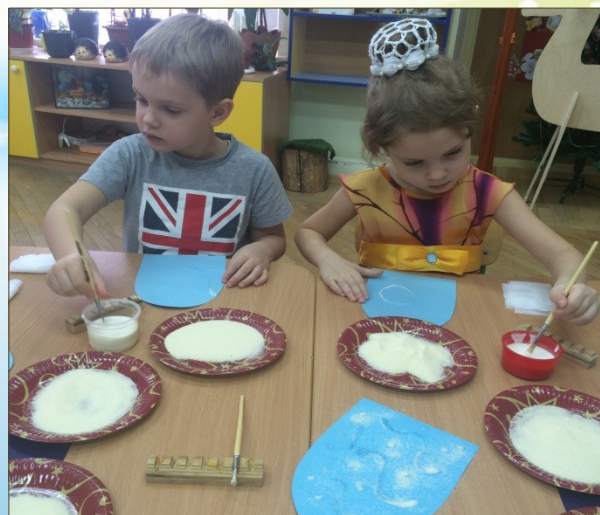
Рисунок для ребенка является не искусством, а речью.