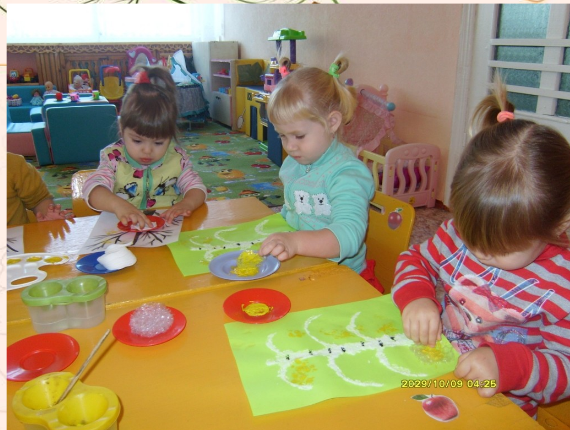
Рисование ватными палочками, солью, осенних листьев