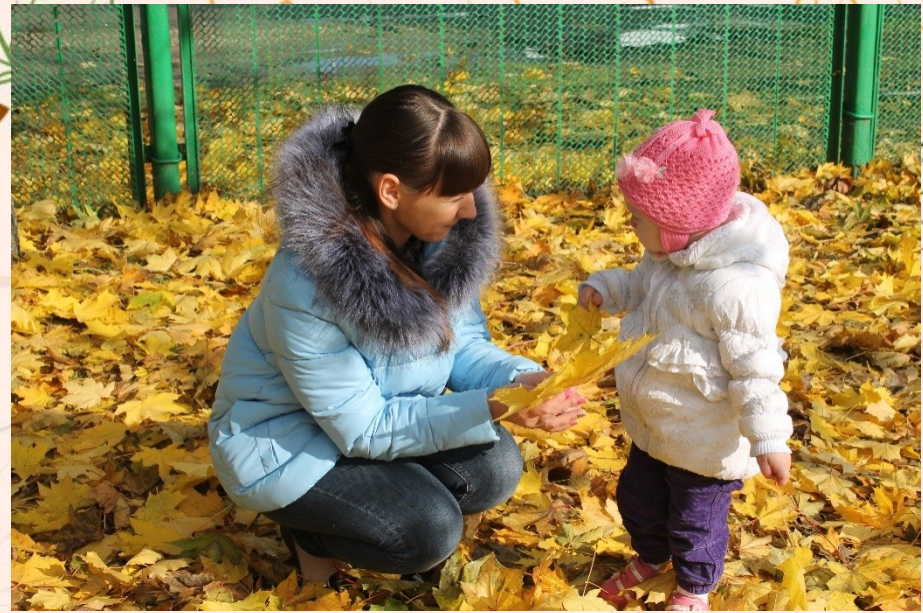
Рассматриваем желтые листочки