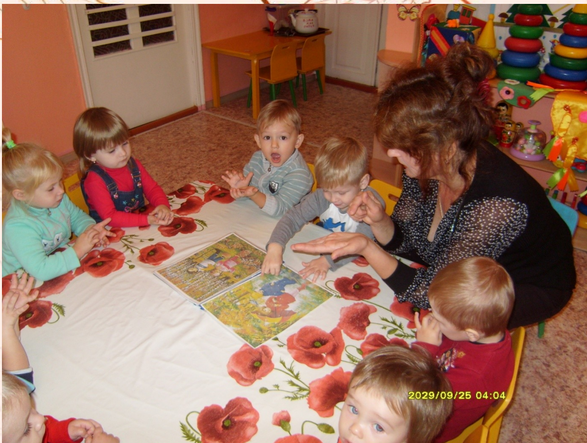
Рассматривание иллюстраций «Приметы осени».