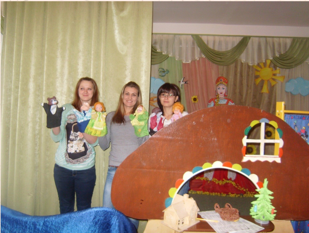
Театр «Осень в лесу»