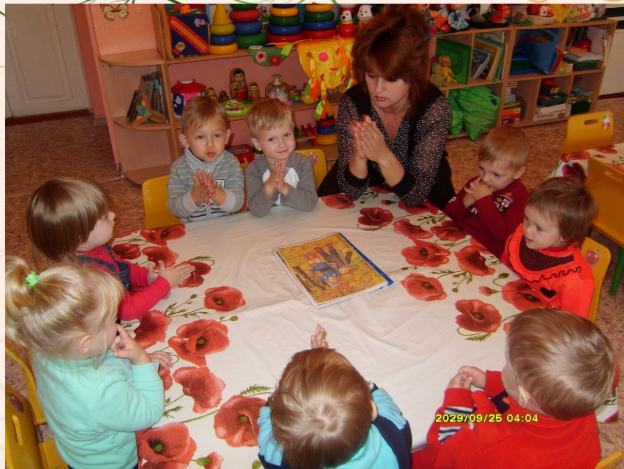
Игры с пальчиками