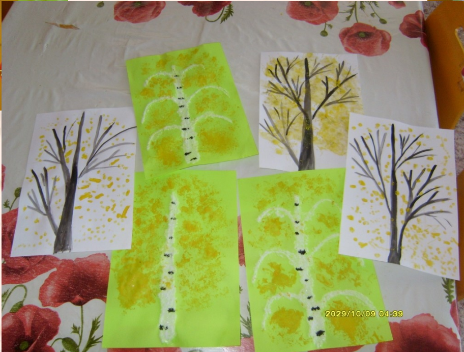
Желтые листочки ватными дисками и упаковочной бумагой