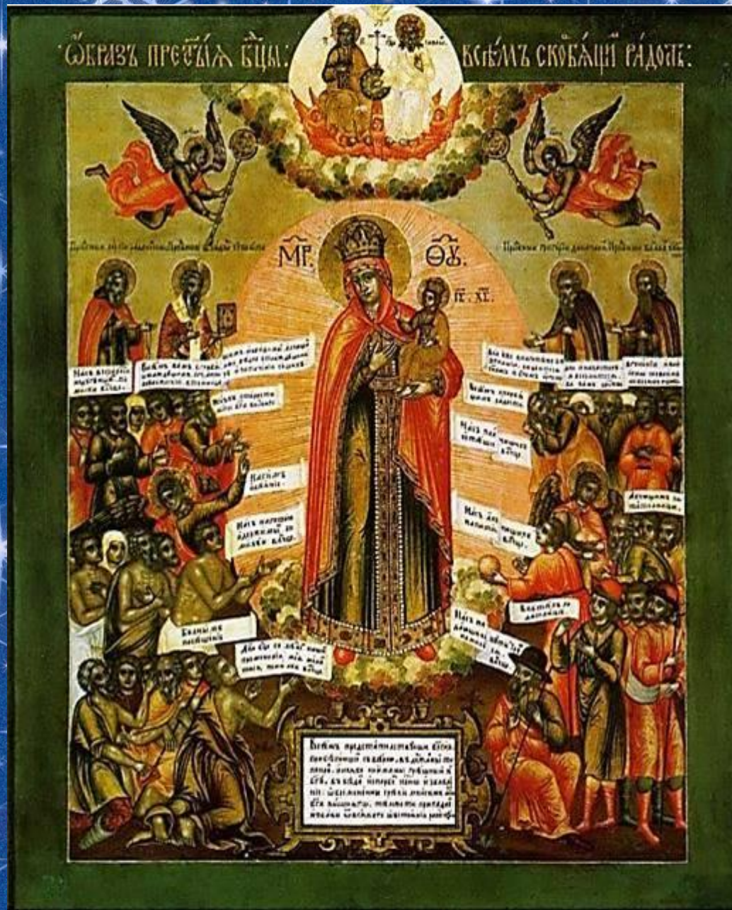
Всех скорбящих Радость. Икона XVIII века