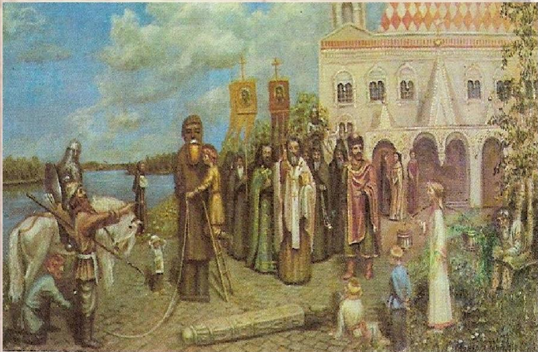
Макарова М. «Свержение идола Перуна»