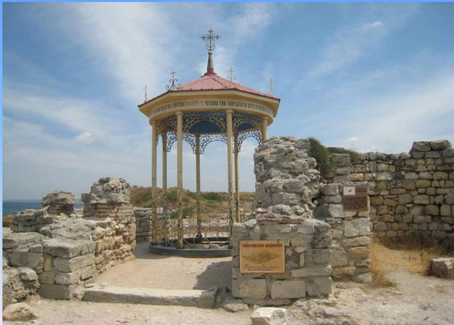
Место Крещения святого князя Владимира