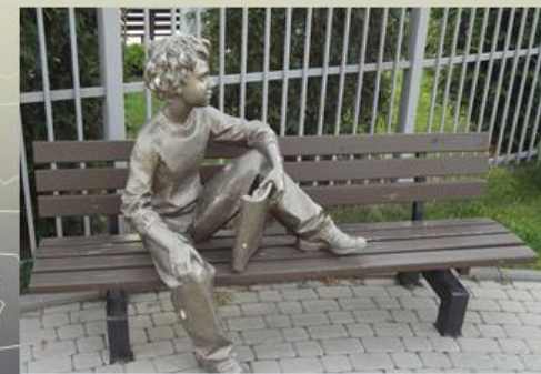
ул. Симферопольская / ул. Сормовская.

Памятник прилежному школьнику, занимающемуся самообразованием круглосуточно и в любую погоду. Очередной памятник, возле которого можно присесть на лавочку и сфотографировать себя и друзей.