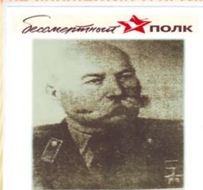
СЕРЕДА КОНСТАНТИН ГЕОРГИЕВИЧ

ГЕРОЙ СОВЕТСКОГО СОЮЗА СЕРЕДА КОНСТАНТИН ГЕОРГИЕВИЧ