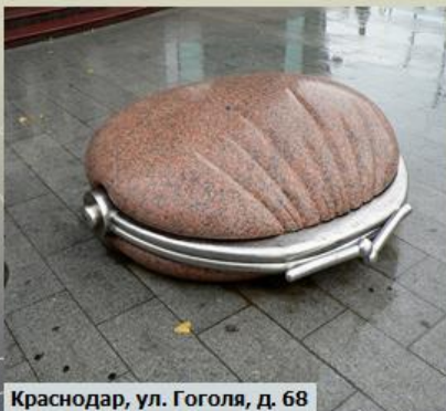
Краснодар, ул. Гоголя, д. 68

Краснодар может похвастаться необычными памятниками, среди которых есть памятник кошельку. Открытие этого памятника было приурочено к 215 юбилею Краснодара и стало одним из подарков горожанам. Кошелек помогает призвать к себе удачу и финансовое благополучие, для этого необходимо лишь посидеть на кошельке или просто потереть об него свой бумажник. Поэтому краснодарский кошелек всегда сияющий и отполированный.