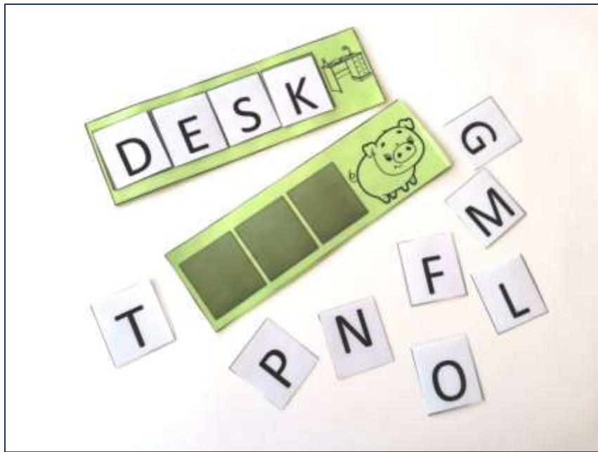
Прием «Собери слово»

Работа, направленная на изучение и закрепление слов и выражений, построенная необычным образом. Примеры приемов для 3-4 классов.