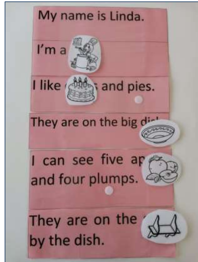
Прием «Замена слов картинками»