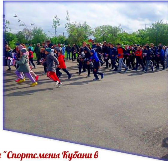
Всекубанская эстафета "Спортсмены Кубани в ознаменовании 77й годовщины Победы советского народа в Великой Отечественной войне"