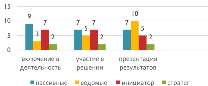
Уровень сформированности креативного мышления 4 класс , ноябрь