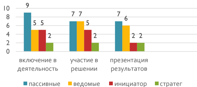
Уровень сформированности креативного мышления 4 класс , сентябрь