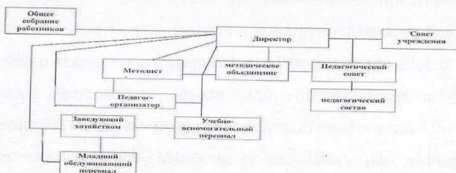
СТРУКТУРА УПРАВЛЕНИЯ МБУ ДО «ЦЕНТР КОМПЕТЕНЦИЙ «ИМПУЛЬС» Г. УСТЬ-ЛАБИНСКА