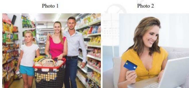
Рис.17 Пример задания № 42 (4) по английскому языку

You will speak for not more than 3 minutes (12–15 sentences). You have to talk continuously.