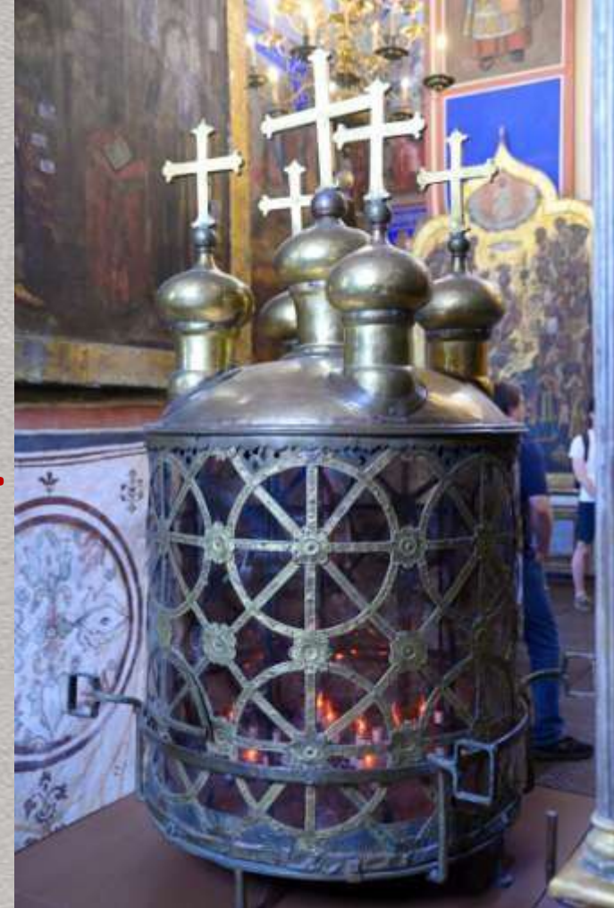
Владимир, Россия. Царь-фонарь.

Включена в Книгу рекордов Гиннеса как пушка самого большого калибра. Орудие массой около 40 тысяч килограммов, длиной 5,4 метра и калибром 890 миллиметров было отлито в 1586 году по именному распоряжению Фёдора Иоанновича, сына Ивана Грозного.