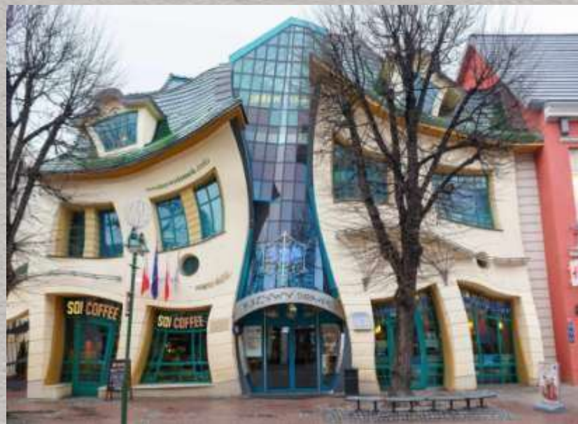
Сопот, Польша. «Кривой» дом.