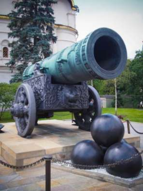
Москва, Россия. Царь-пушка.

Включена в Книгу рекордов Гиннеса как пушка самого большого калибра. Орудие массой около 40 тысяч килограммов, длиной 5,4 метра и калибром 890 миллиметров было отлито в 1586 году по именному распоряжению Фёдора Иоанновича, сына Ивана Грозного.