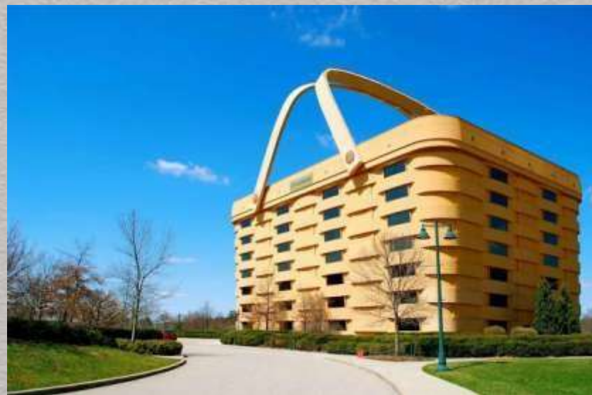
Огайо, США. Дом-корзина.