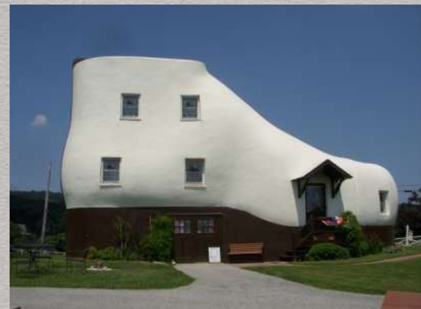
Пенсильвания, США. Дом-ботинок.