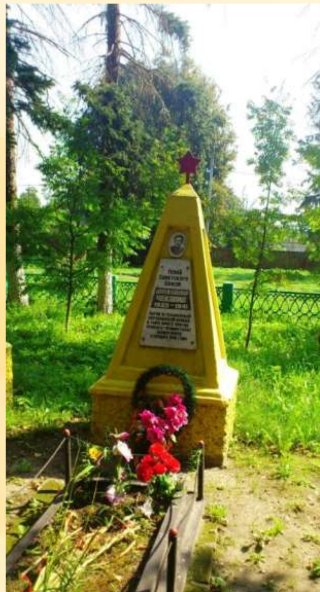
Могила в г. Чекалин