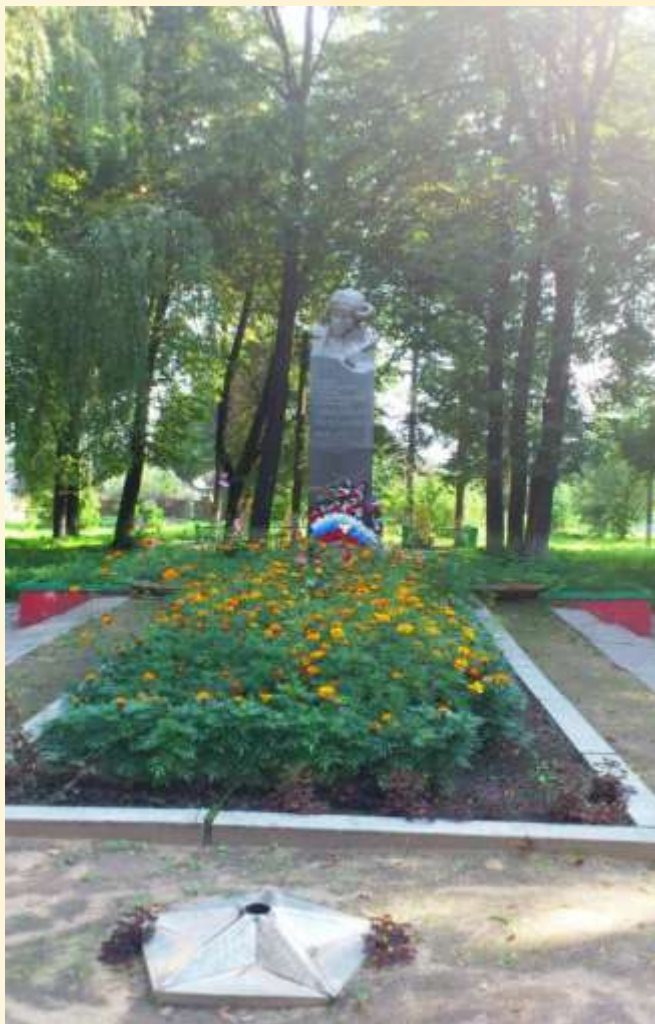
Памятник в г. Чекалин