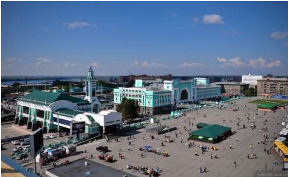
Площадь в Новосибирске им. Гарина Михайловского

Новосибирцы увековечили память о Н. Г. Гарине-Михайловском, присвоив его имя привокзальной площади, станции метро, школе, одной из библиотек города.