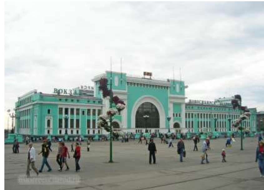
Железнодорожный вокзал им. Гарина-Михайловского