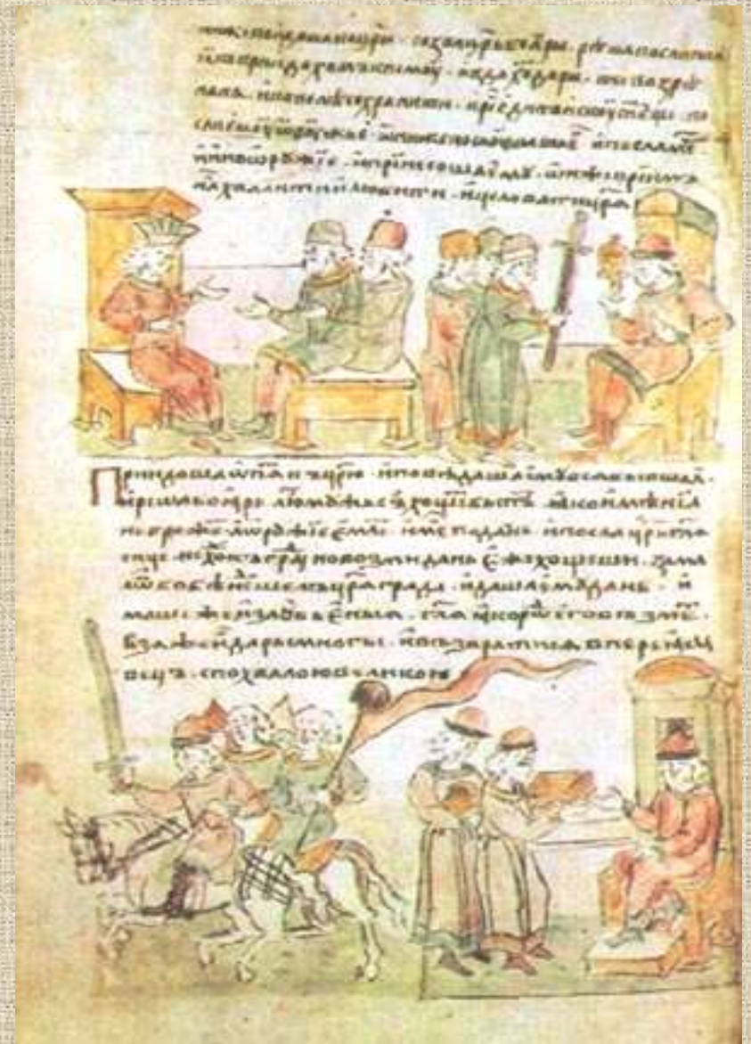
Повесть временных лет. 971 г.

Значение первых библиотек, которые были и просветительскими учреждениями, и книжными мастерскими, и "книгохранилищами" огромно: они сберегли, сохранили для нас ценнейшие памятниками старины.