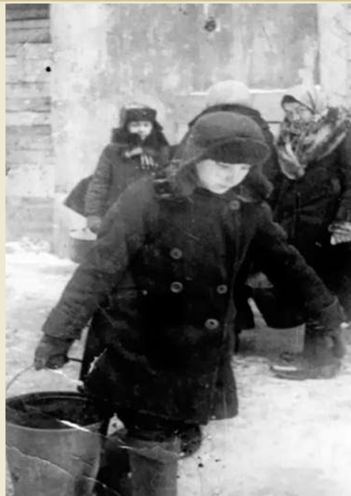
Ходили за водой к Неве...