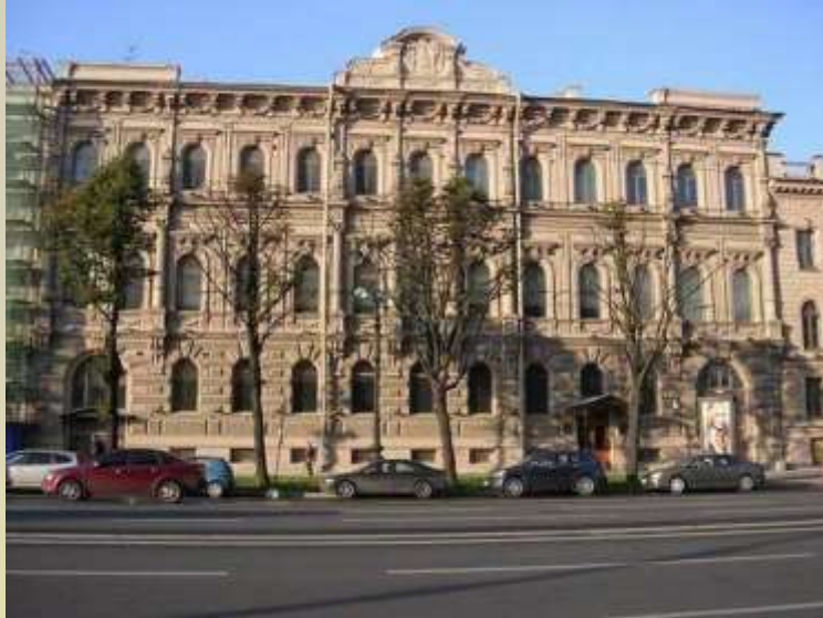
Институт истории искусств

Родилась 16 мая 1910 в Санкт-Петербурге, на старой питерской окраине – Невской заставе, в семье заводского врача. В 1925 году пришла в литературное объединение рабочей молодежи - "Смена", позднее училась на Высших курсах при Институте истории искусств.