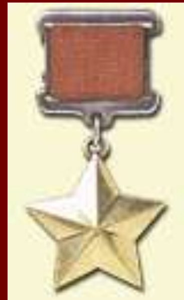
Медаль "Золотая Звезда"