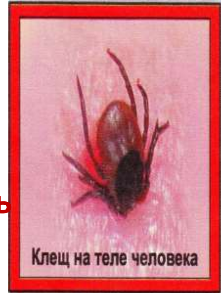
Клещ на теле человека

Важно знать, что прячутся клещи в траве и на ветках кустов, вдоль лесных дорожек и на опушках, а также в зарослях по берегам ручейков.