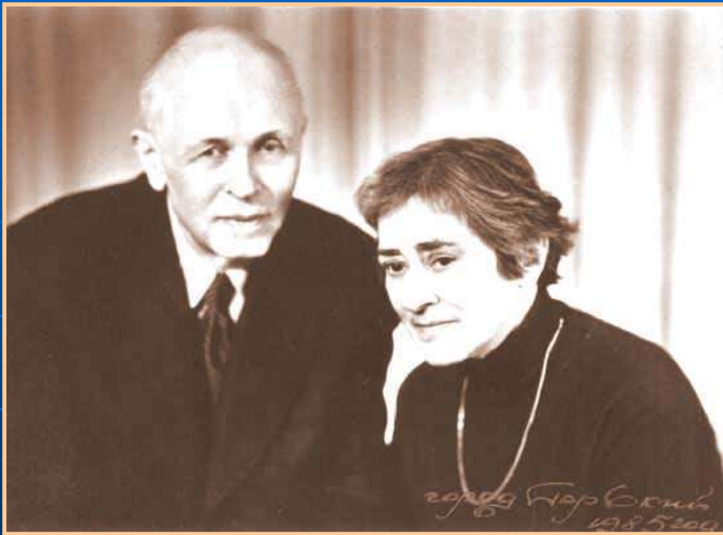
А. Сахаров и Е. Боннэр в своей московской квартире