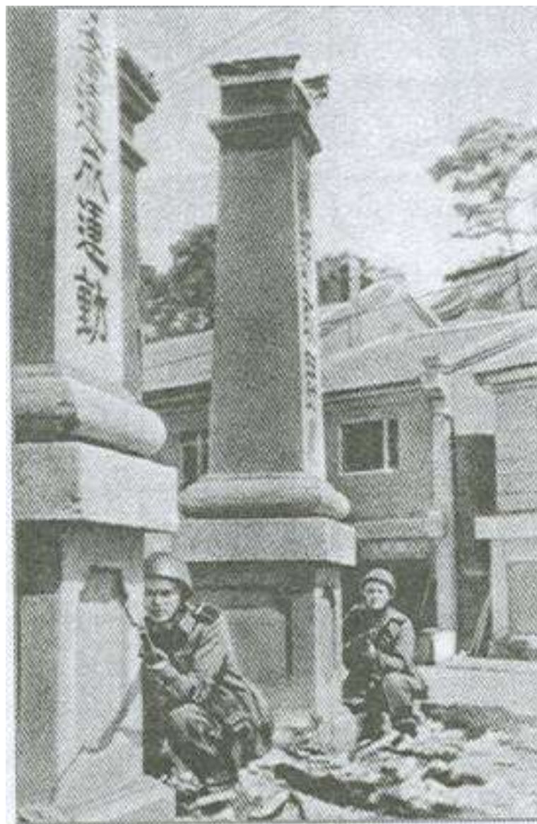
Подразделение 355-го ОБМП ведет бой в Сейсине