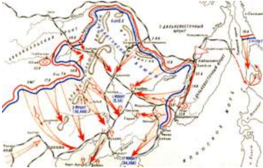
Схема действий советских войск в Советско-японской войне

План советского командования, охарактеризованный как «Стратегические клещи», был прост по замыслу, но грандиозен по масштабу.