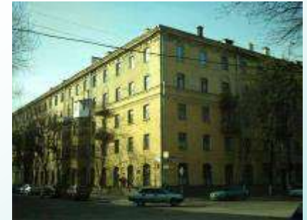
Дом в Воронеже, в котором жил писатель.