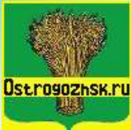
Герб города Острогжска