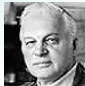
Станислав Иосифович Ростоцкий - режиссёр фильма «Белый Бим Чёрное ухо»