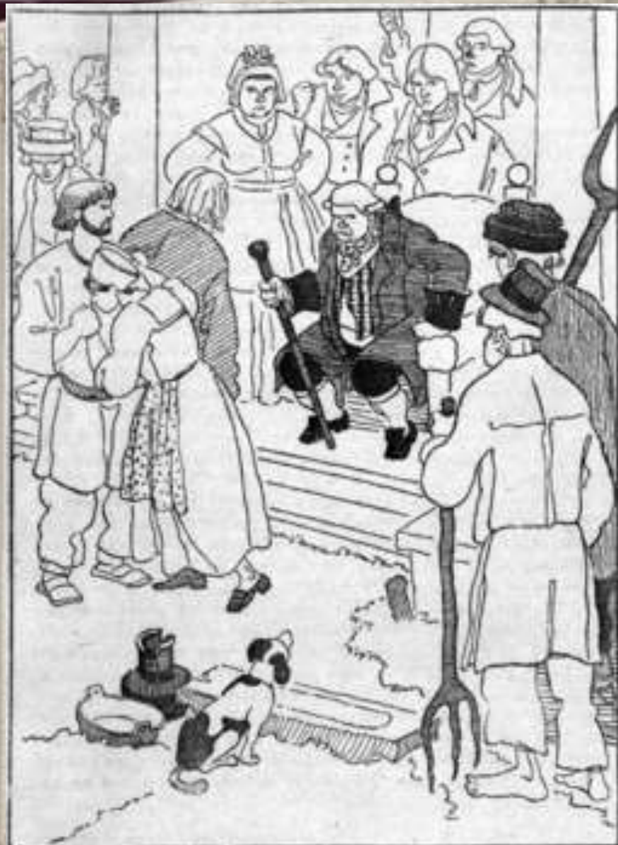
«Городня» Рекрутский набор