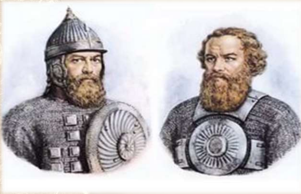
Посадский человек Кузьма Минин

Центром освободительного движения стал Нижний Новгород.