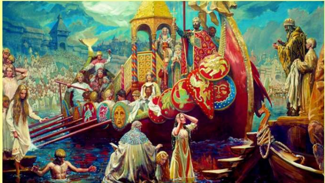
Фрагмент репродукции картины Михаила Шанькова "Крещение Руси"

Владимир объявил христианство государственной религией.