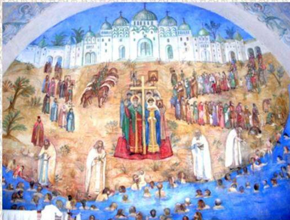
Фреска «Крещение Руси»

Вот как описывает это событие «Повесть временных лет»: «Сошлось там людей без числа. Вошли в воду и стояли там одни до шеи, другие по грудь, молодые же у берега по грудь, некоторые держали младенцев, а уже взрослые бродили, попы же совершали молитвы, стоя на месте. И была видна радость на небе и на земле по поводу стольких спасаемых душ».