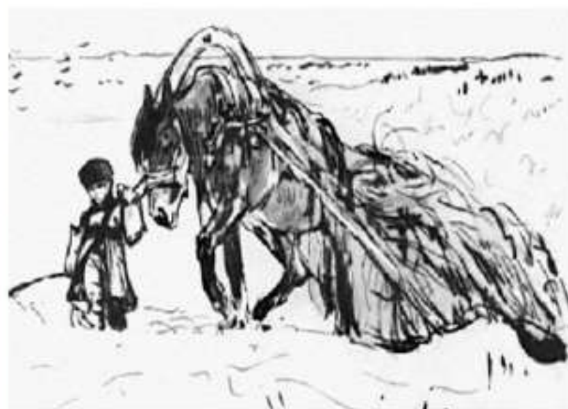
Иллюстрация к стихотворению «Мужичок с ноготок»