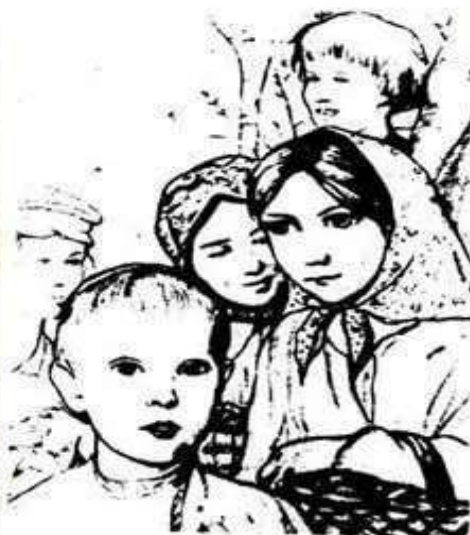
26. Крестьянские дети Художник И. С. Глазунов. 1979