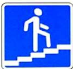
ПОДЗЕМНЫЙ И НАДЗЕМНЫЙ ПЕШЕХОДНЫЕ ПЕРЕХОДЫ