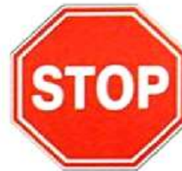
ДВИЖЕНИЕ БЕЗ ОСТАНОВКИ ЗАПРЕЩЕНО