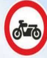
Движение мотоциклов запрещено