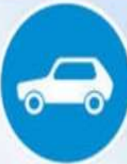
Движение легковых автомобилей