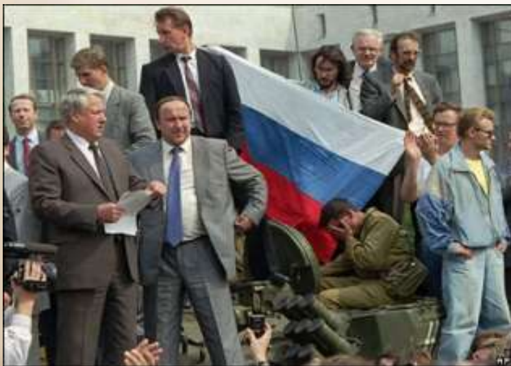
Борис Ельцин (слева) и Александр Коржаков на фоне исторического флага России. Белый дом, Москва, август 1991 года

22 августа 1991 года Чрезвычайная сессия Верховного Совета РСФСР постановила считать официальным символом России триколор, а указом Президента РФ от 11 декабря 1993 года было утверждено Положение о государственном флаге Российской Федерации. В августе 1994 года президент России Борис Ельцин подписал указ, в котором говорится: «В связи с восстановлением 22 августа 1991 года исторического российского трехцветного государственного флага, овеянного славой многих поколений россиян, и в целях воспитания у нынешнего и будущих поколений граждан России уважительного отношения к государственным символам, постановляю: Установить праздник - День Государственного флага Российской Федерации и отмечать его 22 августа».