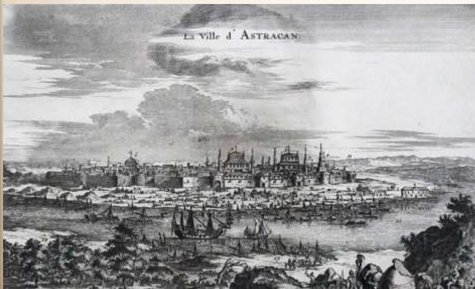
Вид города Астрахани и фрегата «Орёл» с флотилией. XVII век.

Государственный флаг в России появился на рубеже XVII-XVIII веков, в эпоху становления России как мощного государства. Впервые бело-сине-красный флаг был поднят на первом русском военном корабле «Орел», в царствование отца Петра I Алексея Михайловича. «Орел» недолго плавал под новым знаменем: спустившись по Волге до Астрахани, был там сожжен восставшими крестьянами Степана Разина. Законным же отцом триколора признан Петр I. 20 января 1705 года он издал указ, согласно которому «на торговых всяких судах» должны поднимать бело-сине-красный флаг, сам начертал образец и определил порядок горизонтальных полос.