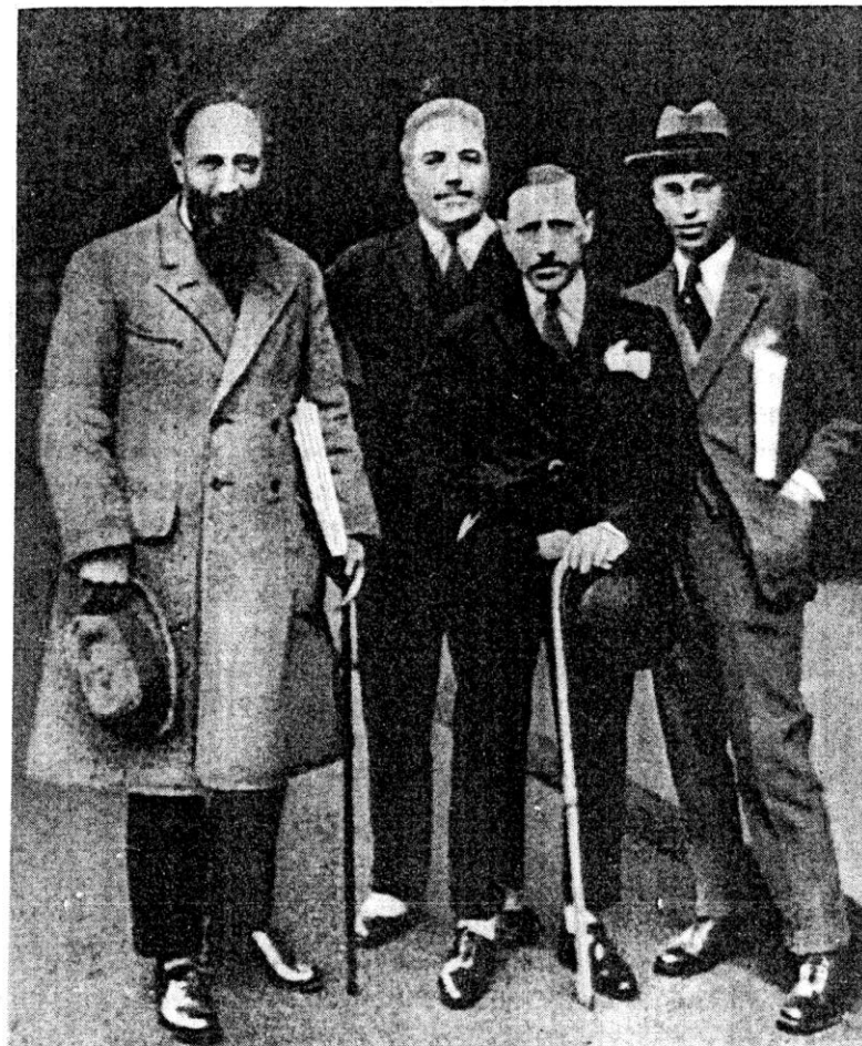
Слева направо: дирижер Э. Ансерме, С. П. Дягилев, И. Ф. Стравинский, С. С. Прокофьев (Лондон, 1921 год)

Создавая балет, Стравинский погрузился в глубины фольклорной архаики и столь радикально обновил музыкальный язык, что на современников балет произвел впечатление разорвавшейся бомбы. Премьера прошла с огромным