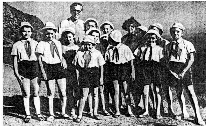
Д. Б. Кабалевский среди детей в Артеке

Кантата и оратория. Эти жанры имели в отечественной музыке особый путь. В 1920-е годы они почти не развивались. Новое героико-революционное содержание с большим трудом находило свое воплощение в жанрах, для которых в прошлом были характерны иные сюжеты в русской музыке — преимущественно религиозно-философские. Лишь во второй половине 30-х годов, когда композиторы обратились к историко-патриотическим темам, в кантатно-ораториальной музыке были достигнуты первые успехи. Лучшие сочинения этого времени — кантаты Прокофьева “Александр Невский” и “К 20-летию Октября”, оратория Шапорина “На поле Куликовом”. Актуальным событиям были посвящены написанные в конце 40-х — начале 50-х годов оратории “Песнь о лесах” Шостаковича и “На страже мира” Прокофьева. Однако подлинный расцвет кантатно-ораториальных жанров начинается со второй половины 50-х годов и связан в первую очередь с творчеством Свиридова.