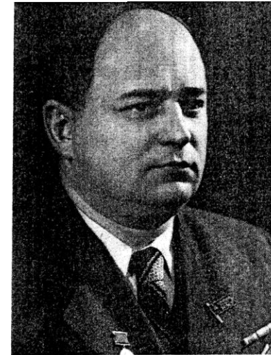
В. Я. Шебалин

ному языку, иметь в своей основе песенные, легко запоминающиеся темы, и не иначе. Такие ограничительные требования к искусству осложняли развитие отечественной музыки, но изменить ход этого развития оказалось невозможным. Несмотря на все трудности и противоречия, ее достижения были очень значительны. 1930 — 1940-е годы стали временем создания многих классических произведений. Среди них симфонии Шостаковича, Прокофьева, Мясковского, балеты Прокофьева “Ромео и Джульетта” и “Золушка”, его опера “Война и мир”, концерты и балеты Хачатуряна, квартеты Шостаковича и Шебалина, романсы Шапорина.