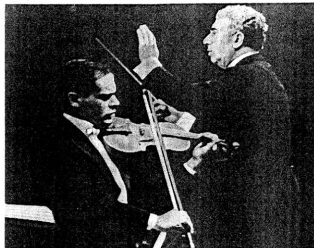
Л. Коган исполняет скрипичный концерт А. Хачатуряна. За дирижерским пультом — автор, композитор А. И. Хачатурян

Выдающимся представителем национальной композиторской школы явился армянский композитор Арам Ильич Хачатурян (1903 — 1978). Его творчество, глубоко самобытное, вышло далеко за пределы страны, стало неотъемлемой частью мировой музыкальной культуры. Темпераментная, жизнерадостная, привлекающая свежестью и оригинальностью мелодики, гармонии, яркостью оркестровых красок музыка Хачатуряна пронизана ритмами и интонациями армянских народных песен и танцев.