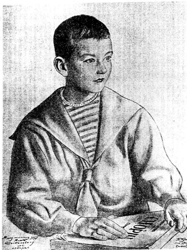
Митя Шостакович в 1919 году. Портрет художника Б. Кустодиева

Видя такие успехи, родители отдали мальчика в музыкальную школу И. Гляссера, где в скором времени он уже играл сонаты Гайдна, Моцарта, фуги Баха. Появились первые собственные сочинения: пьесы “Солдат”, “Гимн свободе”, “Траурный марш памяти жертв револю-