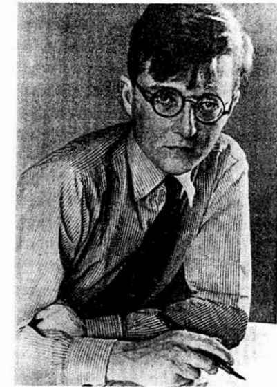
Д. Шостакович в юности

Такая напряженная жизнь при полуголодном существовании (консерваторский паек составлял всего четыре ложки сахара и 400 граммов мяса в месяц!) привела к сильному истощению. А в 1922 году в семью пришла беда: скончался отец, оставив жену и детей безо всяких средств к существованию. Спустя несколько месяцев Шостакович перенес тяжелую операцию, едва не стоившую ему жизни. Несмотря на пошатнувшееся здоровье, пришлось искать работу, устраиваться пианистом-иллюстратором в кинотеатр — сопровождать показ немых кинофильмов подходящей по сюжету музыкой. Большую помощь и поддержку в эти годы оказал юноше Глазунов. Он сумел хлопотать ему дополнительный паек и персональную стипендию.