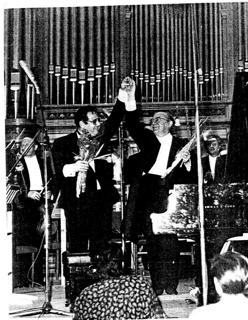
Дирижер Г. Рождественский и пианист Н. Петров после концерта в Большом зале Московской консерватории

Исполнительское искусство. В характеризуемый период высокий международный авторитет завоевывает отечественное исполнительское искусство. Всемирную известность получают такие музыканты, как певцы И. Архипова, Е. Образцова, Т. Синявская, Л. Казарновская, В. Атлантов, Е. Нестеренко, А. Ведерников, Д. Хворостовский; пианисты В. Ашкенази, Л. Власенко, В. Крайнев, В. Кастельский, Н. Петров, М. Плетнев, Е. Кисин; скрипачи В. Третьяков, О. Крыса, В. Ре-