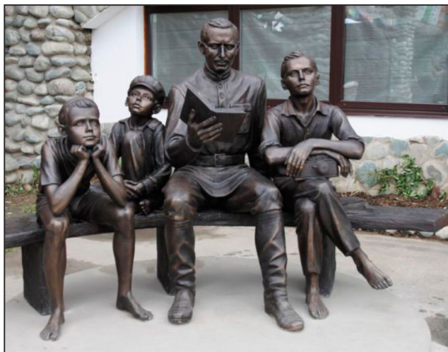
Скульптура «Макаренко с детьми». Установлена у входа в культурно-образовательный центр «Этномир» в Калужской области. Автор- Алексей Леонов. Материал - бронза.

Пути поколения Рассказы О человеческих чувствах Из истории героизма Гришка Случай в походе В день Первого Мая Несколько часов на канале Три разговора Незабываемая встреча Симфония Шуберта Премия Доктор Преподаватель словесности Домой хочу Новые годы В библиотеке