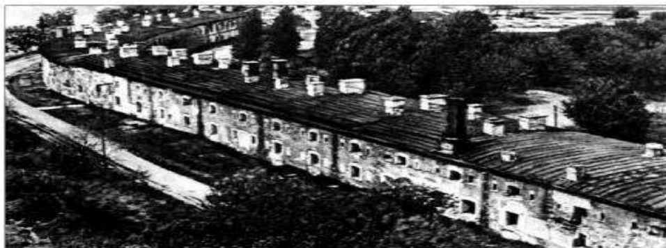
Вид на казармы Брестской крепости. Это кольцевая стена цитадели. Снимок сделан уже в послевоенное время.