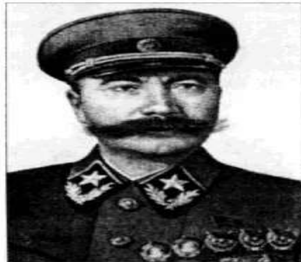
Командующий войсками Северо-Кавказского фронта Маршал Советского Союза С.М. Буденный.

держала оборону 12-я армия Южного фронта, но здесь особой активности противник не проявлял.