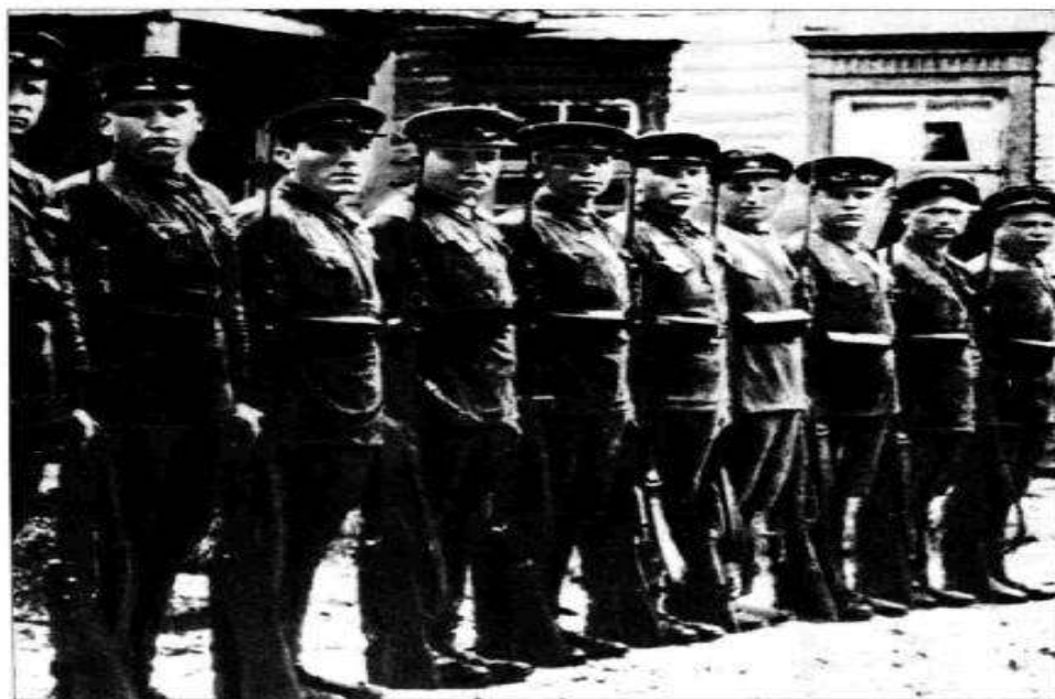
Развод караулов в одном из подразделений, дислоцированных на территории Брестской крепости. Скорее всего это пограничники 17-го погранотряда. 1941 год.