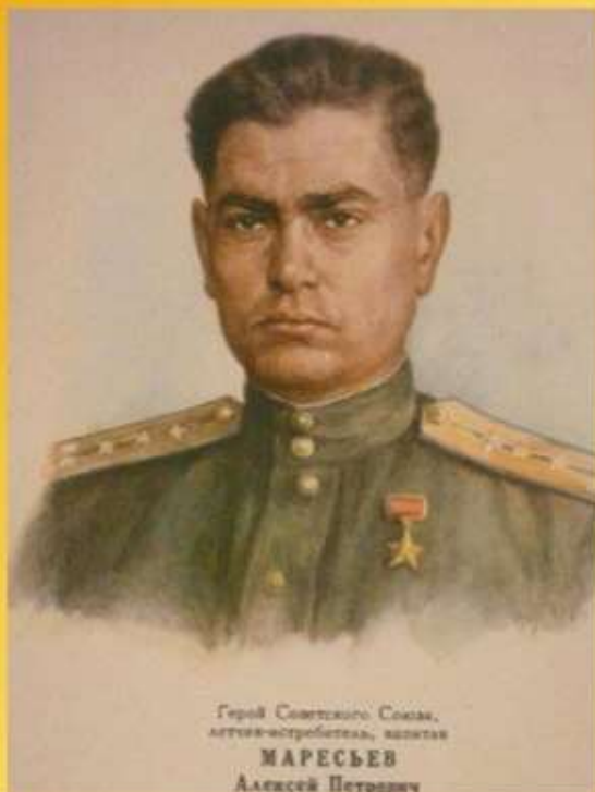
Герой Советского Союза, летчик-истребитель, капитан МАРЕСЬЕВ Алексей Петрович

В 1942 году его самолет был сбит. Раненый Маресьев ползком добрался до своих. Но обмороженные ступни пришлось ампутировать. Травма не помешала летать. Научившись заново управлять самолетом с протезами, Маресьев вернулся в строй. Сбил 11 вражеских самолетов, в том числе с ампутированными ногами - 7 фашистских самолетов.