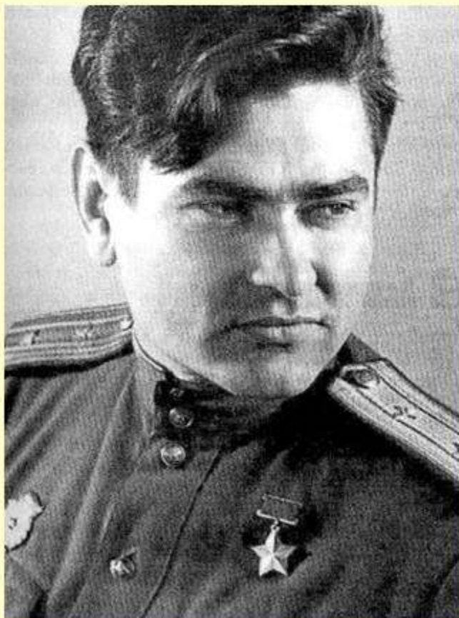
Таким был А. Маресьев в 1946 году

«...Мог ли я тогда думать, что судьба сдружит меня с ЭТИМ человеком, свяжет на всю жизнь», - писал Борис Полевой в 1943 году