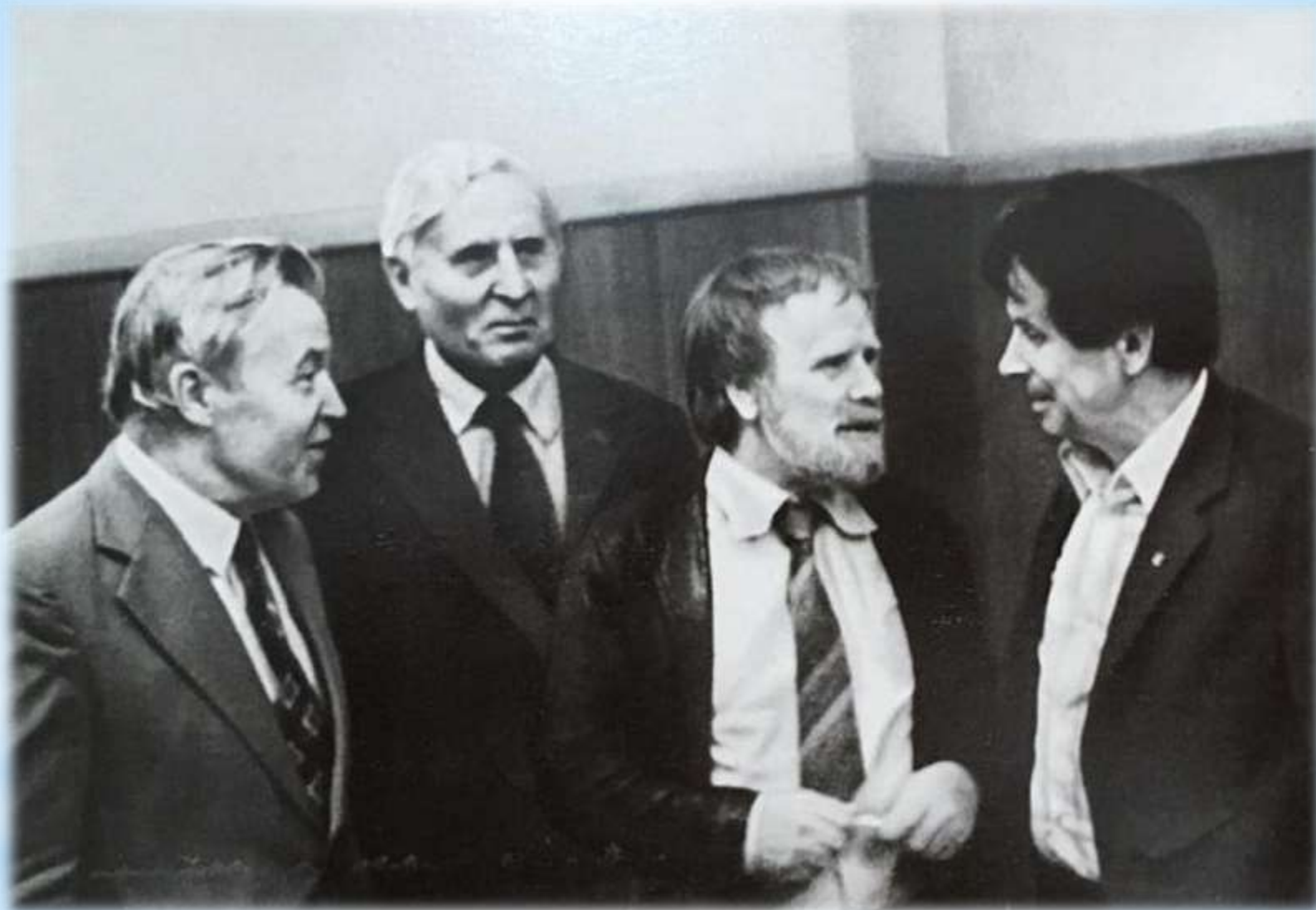
На VII съезде писателей СССР (слева направо: С. Залыгин, А. Калинин, В. Белов, Ф. Абрамов). Москва, 1981 г.