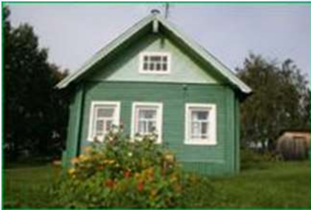
Дом Ф. Абрамова в Верколе