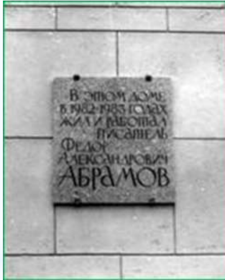
Мемориальная доска в С. Петербурге на доме, где жил Ф. Абрамов (Мичуринская, 1)