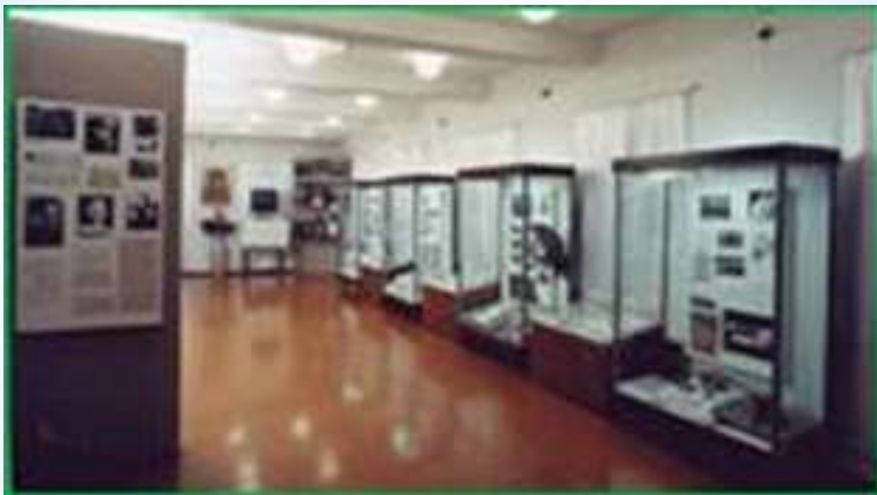
Верховский литературно-мемориальный музей им. Федора Абрамова (создан в 1984 году)