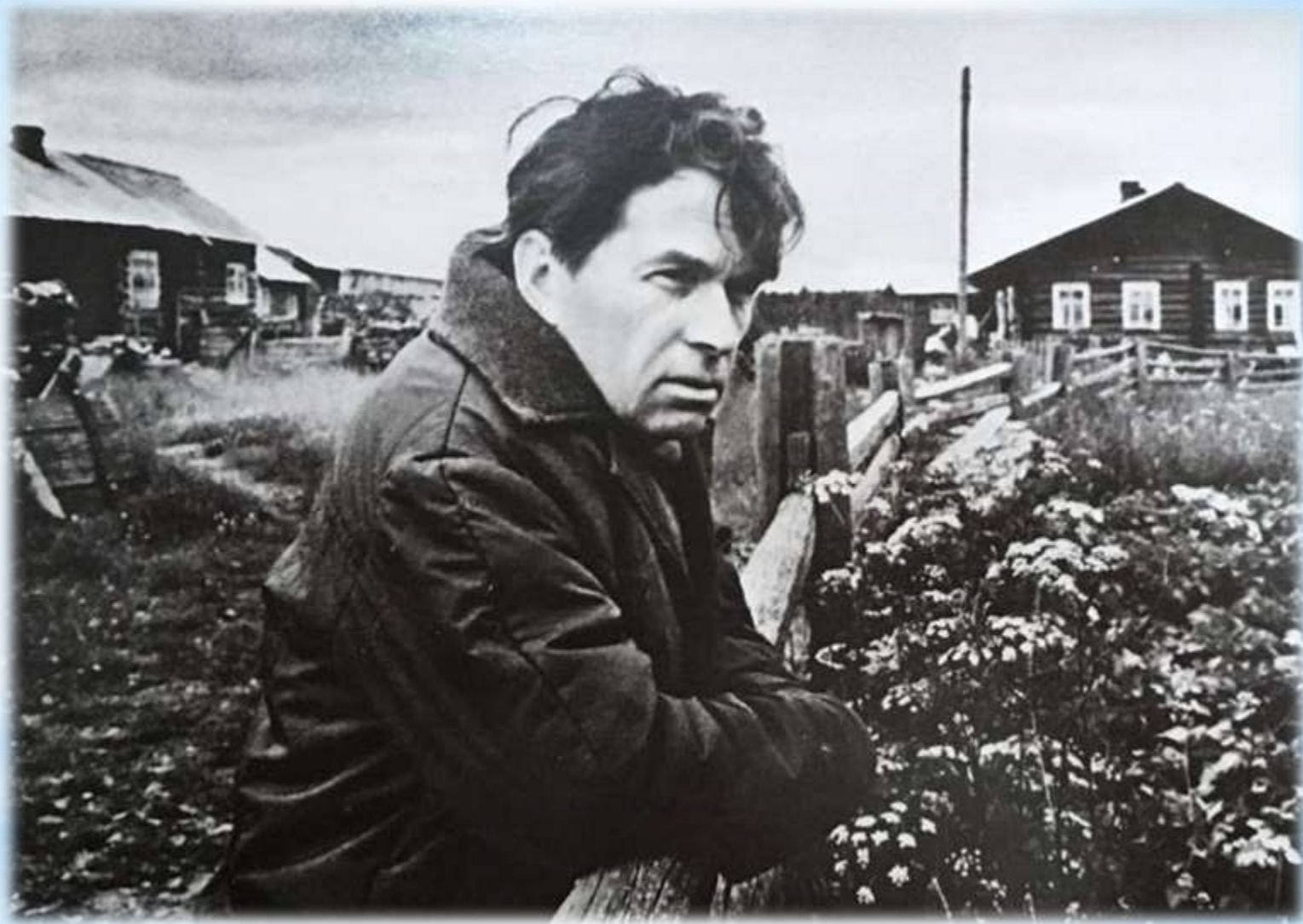
У изгороди. Веркола, 1976 г.