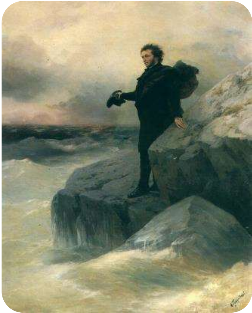
«Пушкин на берегу моря», И.Айвазовский 1887

Погасло дневное светило; На море синее вечерний пал туман. Шуми, шуми, послушное ветрило, Волнуйся подо мной, угрюмый океан.