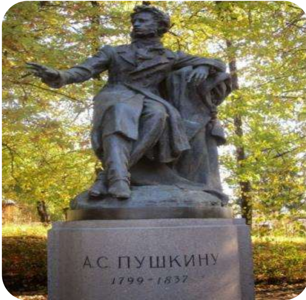
Памятник Пушкину в Михайловском