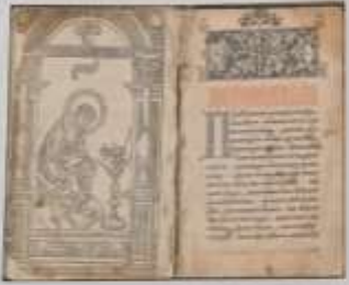
Иллюстрация к «Апостолу» (1564 г.)

Иван Федоров в Москве успешно освоил искусство книгопечатания. С помощью мастера из Кракова он успел выпустить 1500 и 1000 экземпляров «Апостола» и «Псалтыря» соответственно. Но самым ценным творением Ивана Федорова в печатном деле стала «Псалтырь» — первая печатная книга в России. Впервые в истории печатного дела Иван Федоров использовал в качестве шрифта кириллицу. Успехом можно считать и то, что Иван Федоров использовал в качестве шрифта кириллицу. Успехом можно считать и то, что Иван Федоров использовал в качестве шрифта кириллицу.