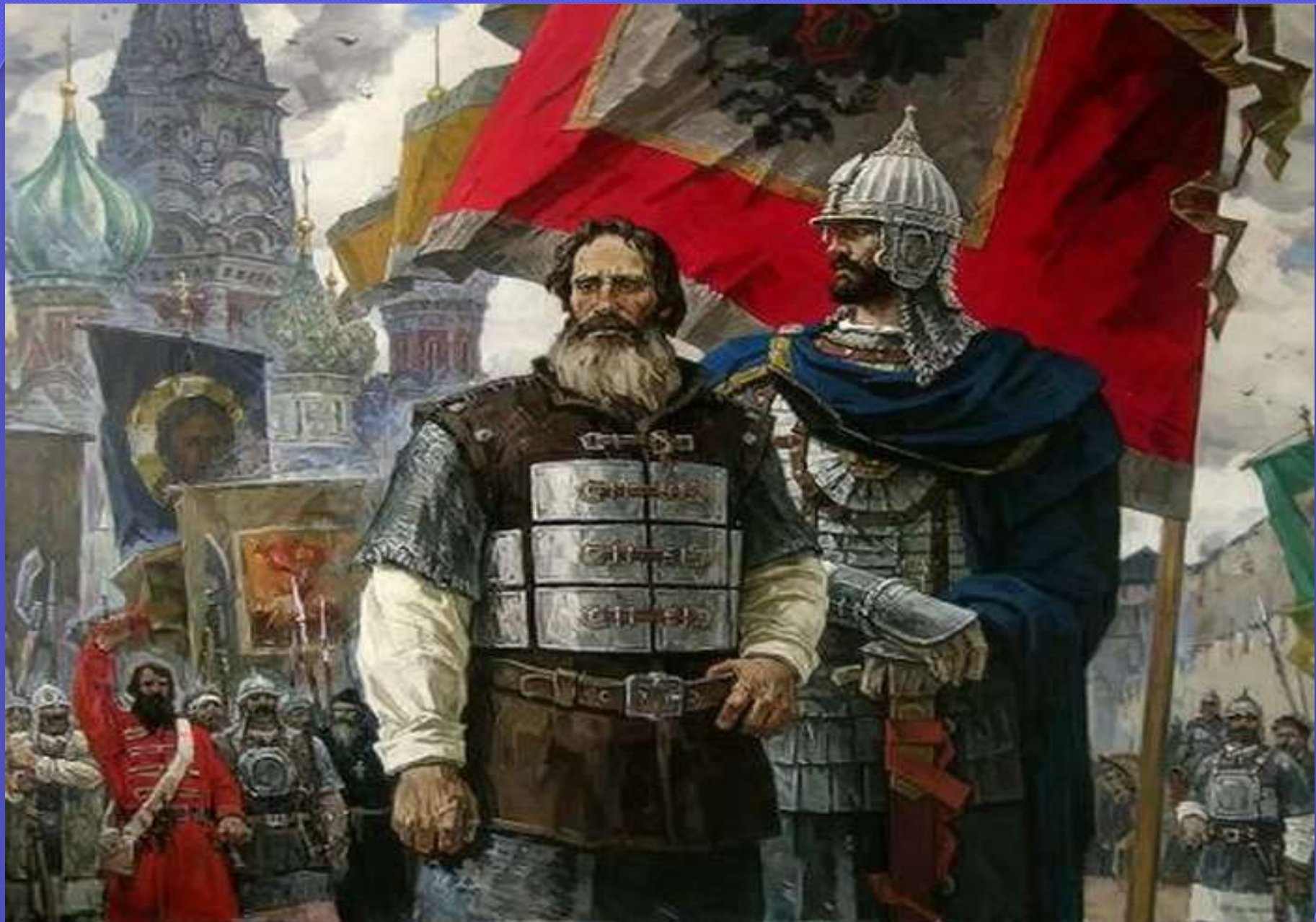
Кузьма Минин и Дмитрий Пожарский