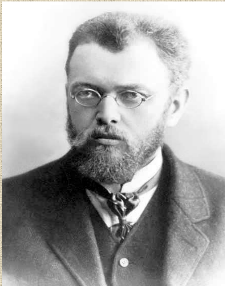
Валентин Феликсович Войно-Ясенецкий. 1910 г.

Святитель Лука (в миру Валентин Феликсович Войно-Ясенецкий), также как и святой апостол, обучался наукам и рисованию. Окончил художественную школу. Однако принял решение стать врачом, чтобы приносить пользу обществу.