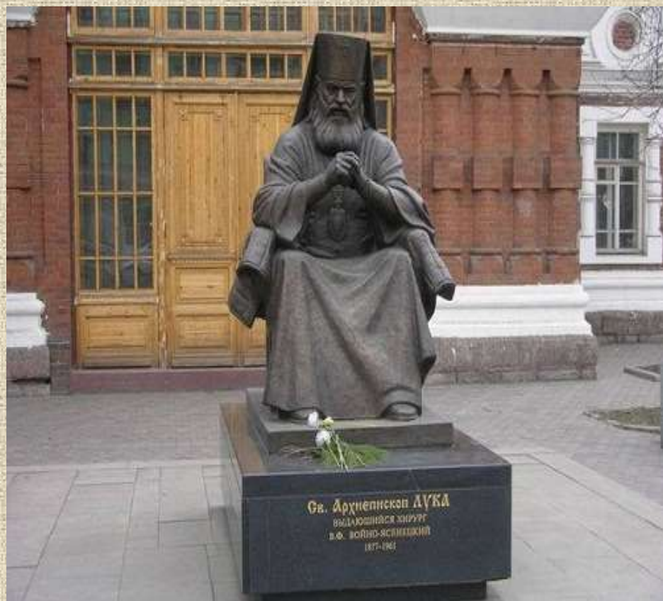
Памятник св. Луке в Свято-Троицком женском монастыре

В 1946 году владыка Лука становится архиепископом Крымским и Симферопольским. В Симферополе прошли последние 15 лет его жизни. Талантливый проповедник, он в 1954 году за 11 томов своих проповедей был избран почетным членом Московской духовной академии.